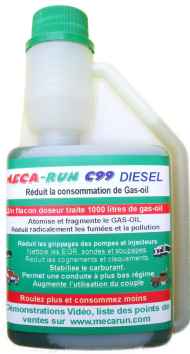
C 99 diesel

Flacon 250 ml traite jusqu'à 1 000 litres