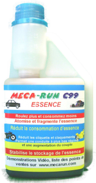
C 99 essence