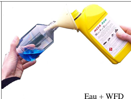
Eau + WFD