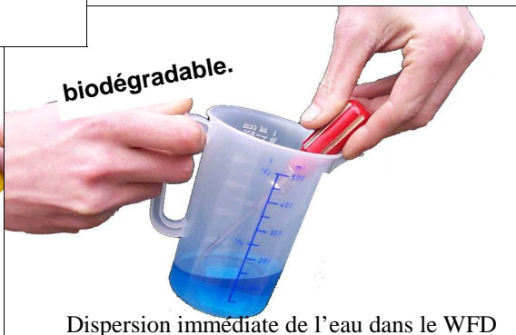
Dispersion immédiate de l'eau dans le WFD